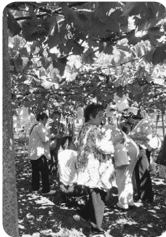
食べ放題のぶどう園

秋晴れの9月14日、戸塚A支部のぶどう狩りは、小学生から高齢者の方々の44人が参加されました。まずは富士山世界遺産センターで映像での富士登山の感覚を味わい、続いて支部委員さんの親戚のぶどう園に行き、秋の味覚を堪能しました。