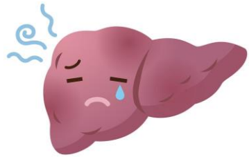
『脂肪肝が増えている』

コロナ禍で食生活が乱れ、運動不足になる人が増えていることから「脂肪肝」に罹るリスクが高まっています。自宅で過ごす時間が増えたため、無意識に果物やお菓子に手が伸びてしまったり、自宅で気にせず好きなだけ飲めるのでアルコール量も増えている人も多いようです。