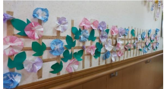
コーヒのフィルターに色をつけて朝顔を制作

蒸し暑さが増し暑さが体に堪える季節ですね。夏は気温と湿度が高い日が多く体調を崩しやすい時期でもあります。今年もマスクをしているためか？暑さを感じやすく熱中症の危険も増し体調管理が大切です。夏バテを防ぎ猛暑を乗り切るには「しっかり休養!!」「適度な運動!!」をお勧めします。十分な睡眠をとり疲労した体を十分に休ませて疲労回復を図ることが大切だそうです。