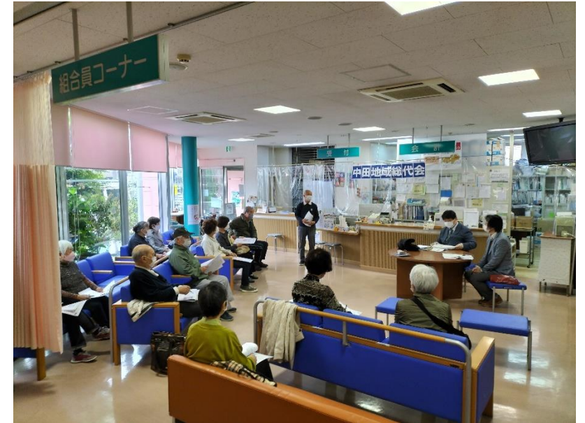
（ 中田地域総代会 4/20 午後 ）